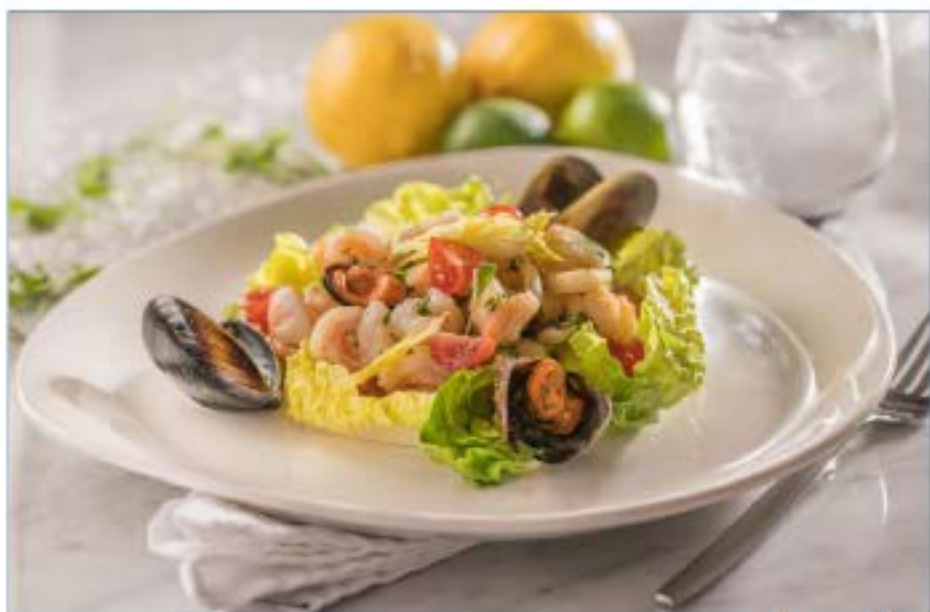
إنسالاتا دي ماري