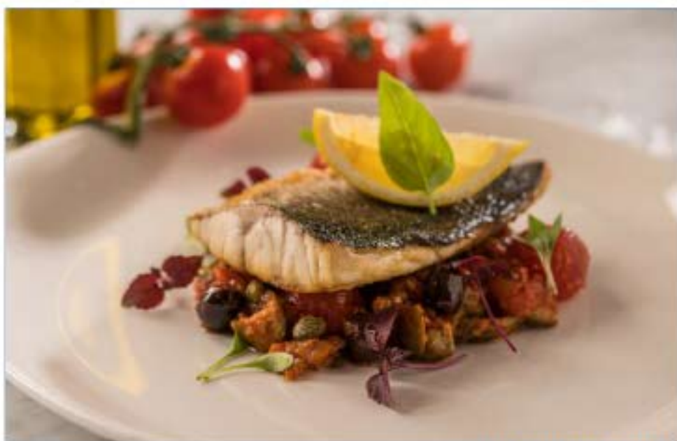
SALMONE ALLA GRIGLIA