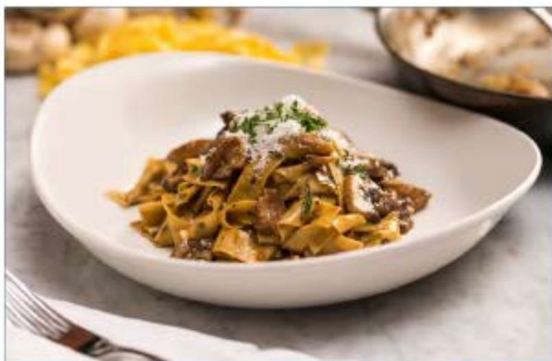
PAPPARDELLE FUNGHI E PECORINO