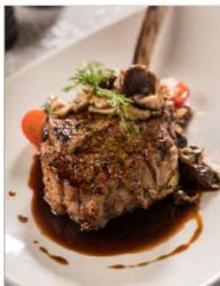
COSTATA DI VITELLO ALLA GRIGLIA