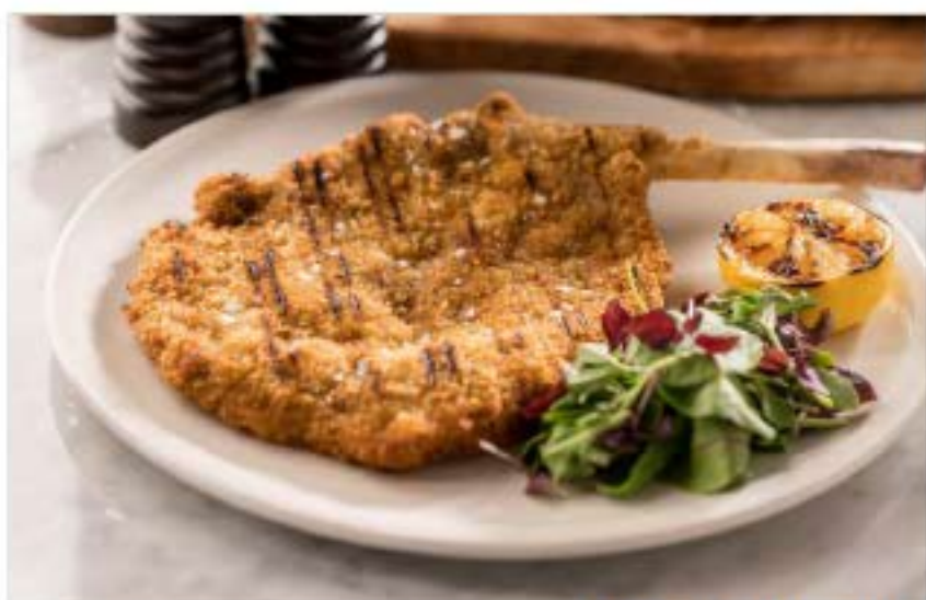
COTOLETTA ALLA MILANESE