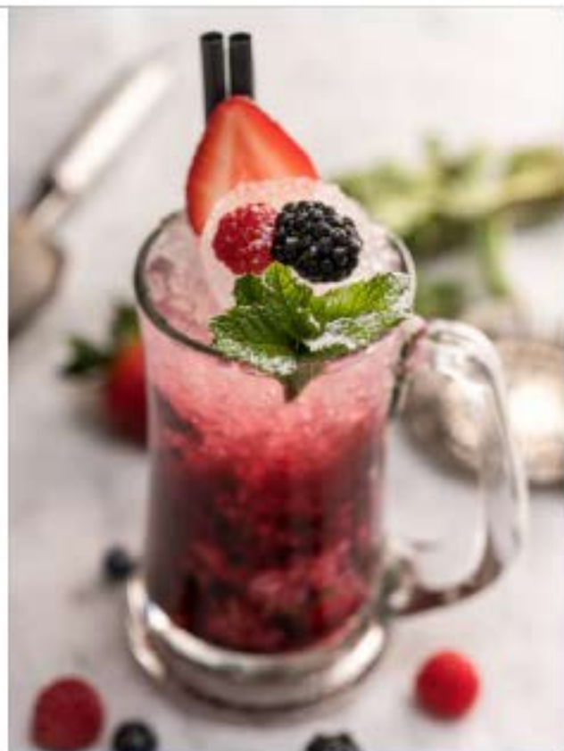
طروتي دي بوسكو