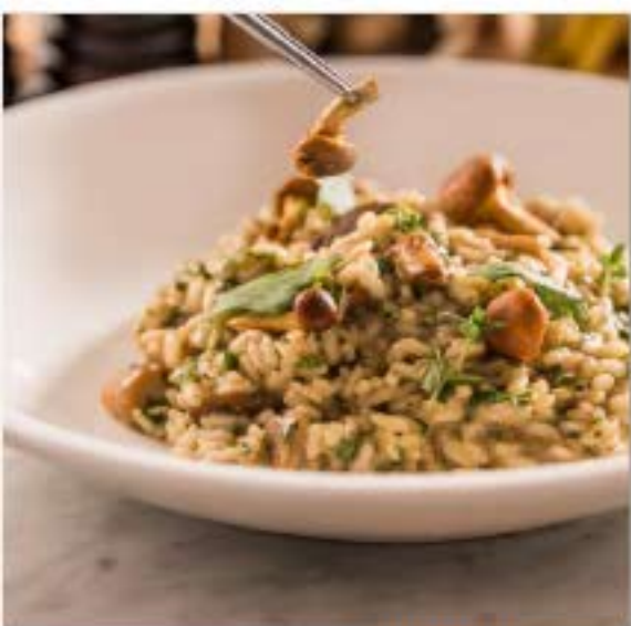
RISOTTO AI FUNGHI