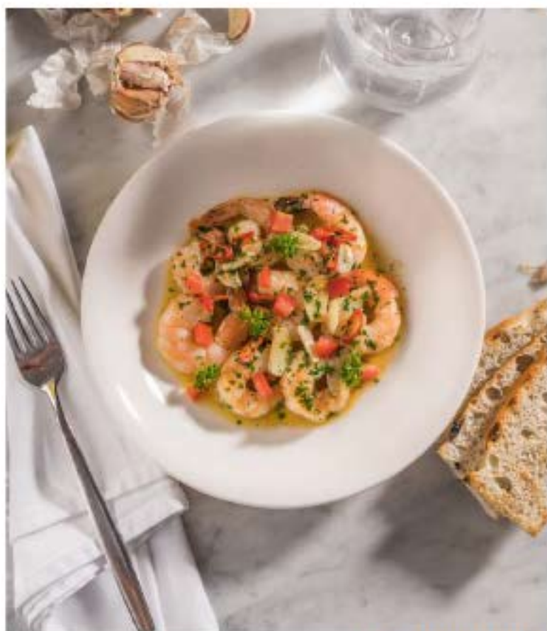
GAMBERONI ALL' AGLIO