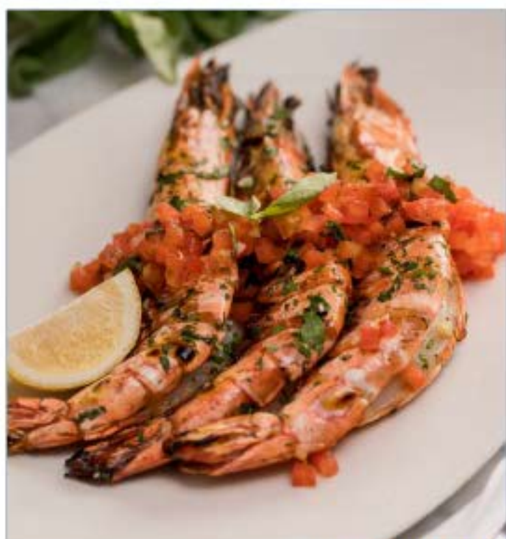
GAMBERONI ALLA GRIGLIA