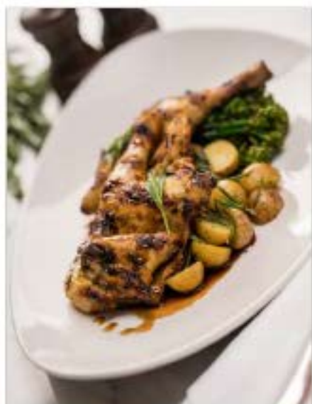
GALLETTO ALLA GRIGLIA