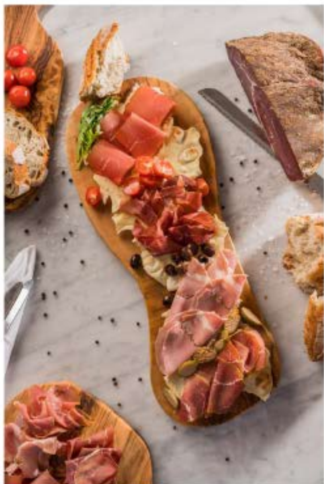
سپليزوني دي سالومي كونيوكو فرينو