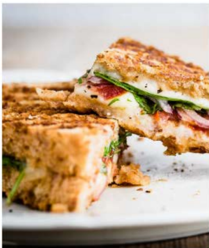
BUFFALO MOZZARELLA & TOMATO PANINI