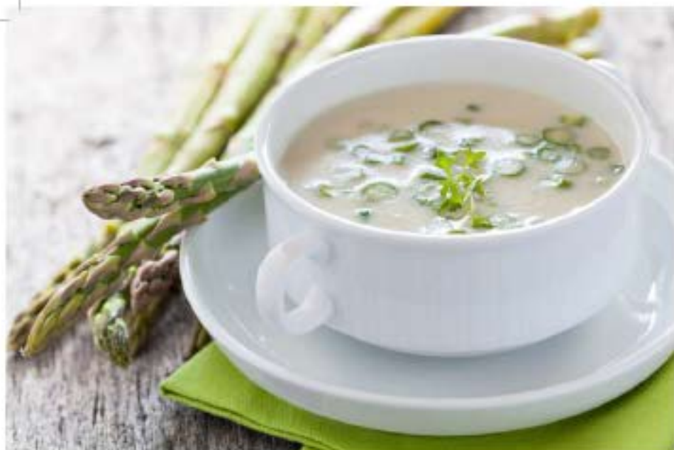
ZUPPA DI ASPARAGI